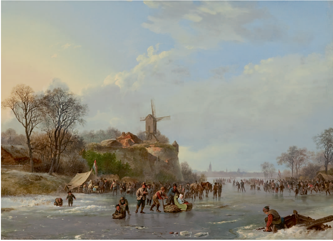
Barend Cornelis Koekkoek IJsvermaak op de rivier

‘Eigenlijk is dit een getekend schilderij in olieverf. Een Avercamp van de 19 e eeuw. Je ziet hieraan dat B.C. Koekkoek een briljant tekenaar was.’