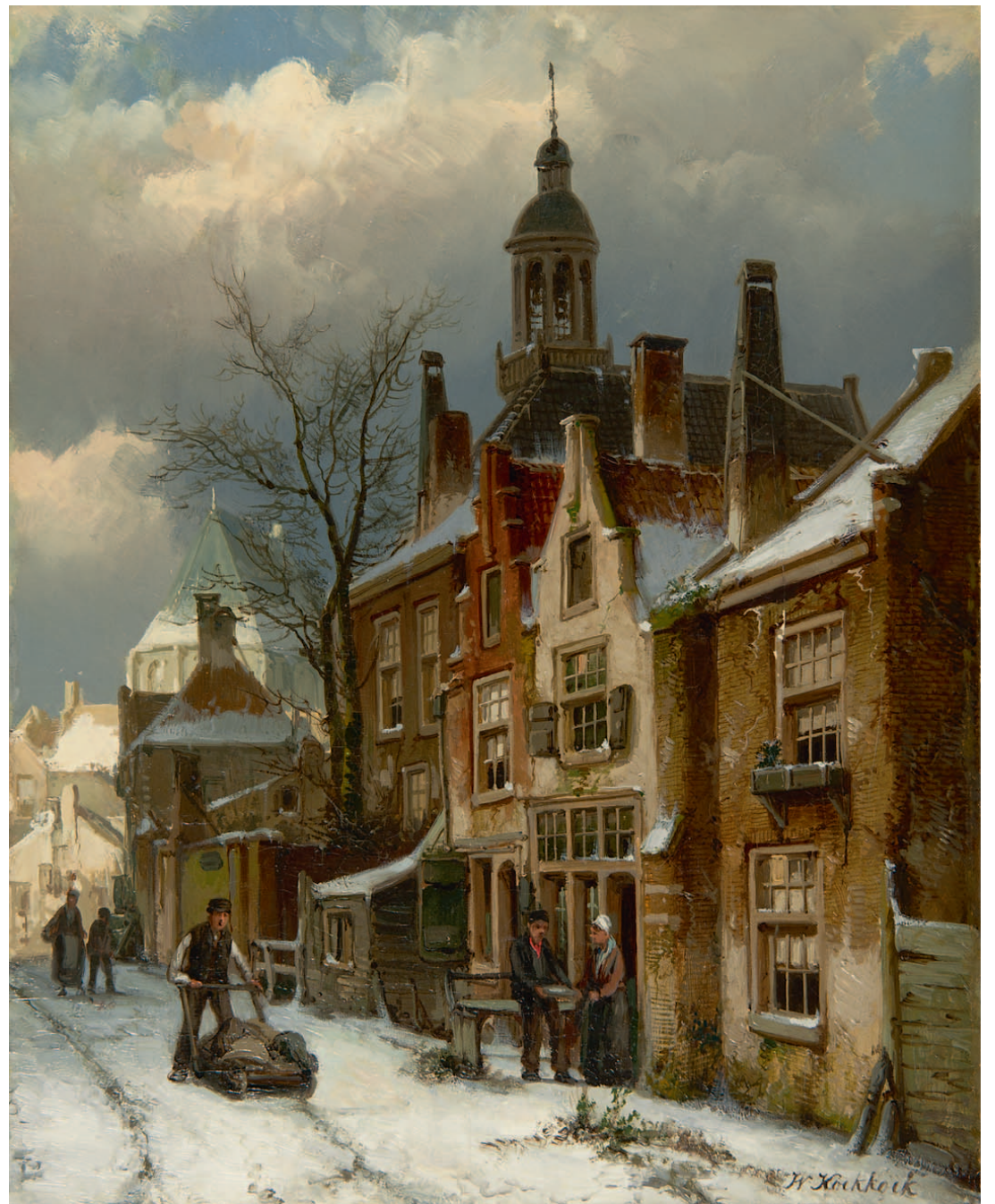
Willem Koekkoek Winters straatje