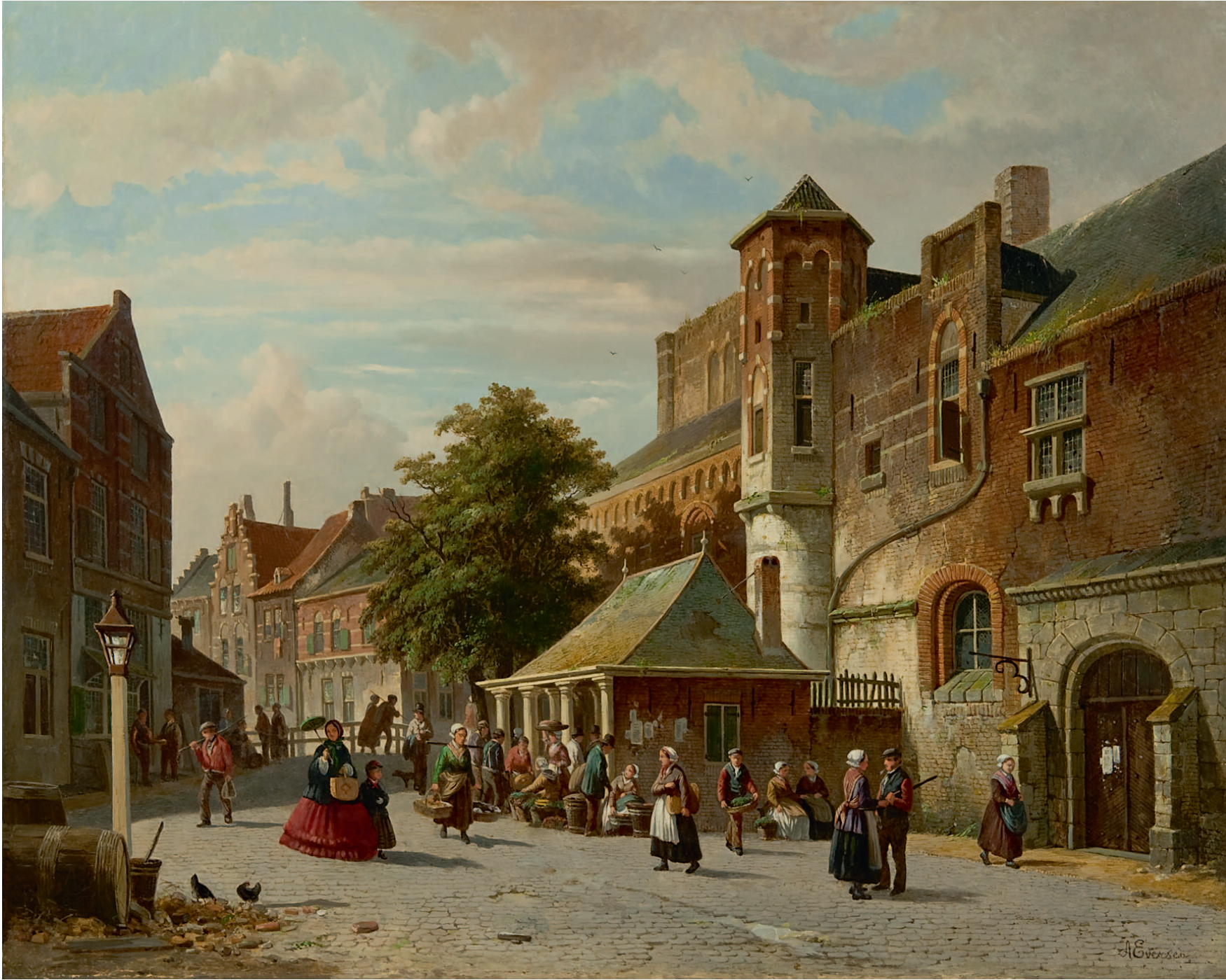
Adrianus Eversen Stadsgezicht met visbank

Adrianus Eversen Amsterdam 1818-1897 Delft Stadsgezicht met visbank , doek 56,2 x 70,2 cm, dubbel gesigneerd. Herkomst: Galerie Mensing, Duitsland, 1990. Lit.: Pieter Overduin, Adrianus Eversen (1818-1897). Schilder van stads- en dorpsgezichten , Giessenburg 2010, pag. 242, cat.nr. 56-5 (met afb. in kleur).