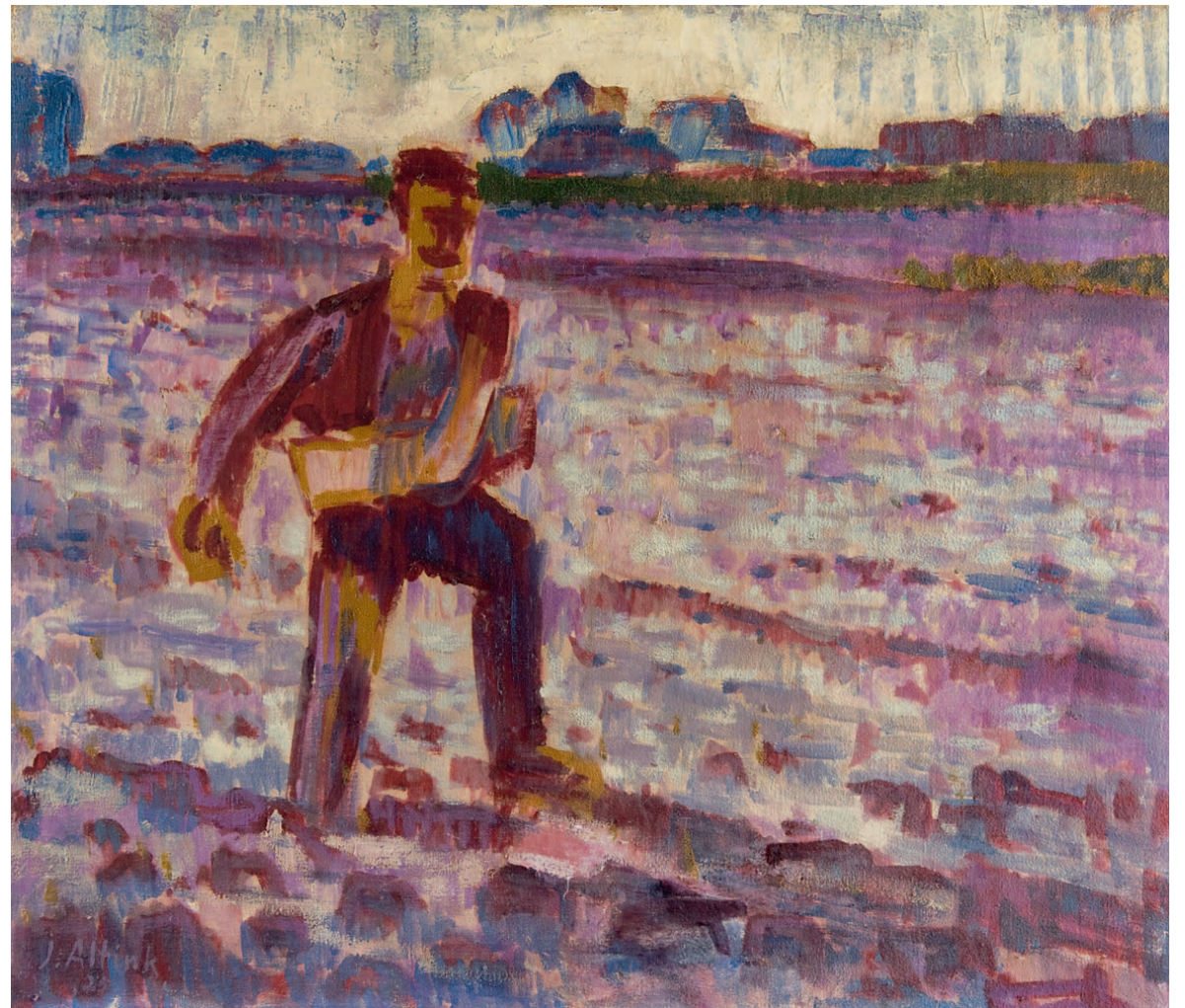
Jan Altink Zaaier, tegenlicht

'Dit schilderij is misschien niet lieflijk, maar het kan je aangrijpen vanwege de expressie van non-naturalisme. Het is een icoon van het kleurrijke expressionisme dat vanuit Duitsland en Zwitserland kwam overwaaien.'