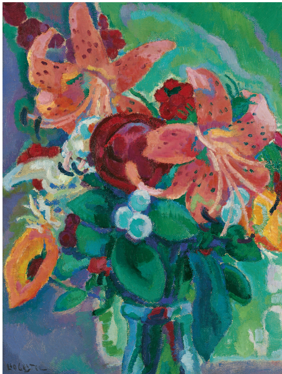
Leendert 'Leo' Gestel Bloemstillevens met tijgerlelies

'Dit schilderij is misschien niet lieflijk, maar het kan je aangrijpen vanwege de expressie van non-naturalisme. Het is een icoon van het kleurrijke expressionisme dat vanuit Duitsland en Zwitserland kwam overwaaien.'