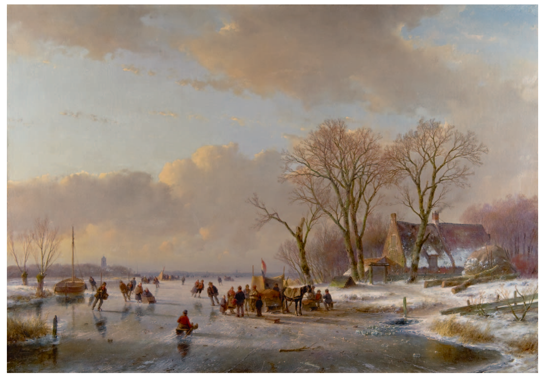
Andreas 'Andries' Schelfhout Schaatspret op een bevroren rivier

‘Gevallen schaatsers zie je niet zo vaak op romantische schilderijen’