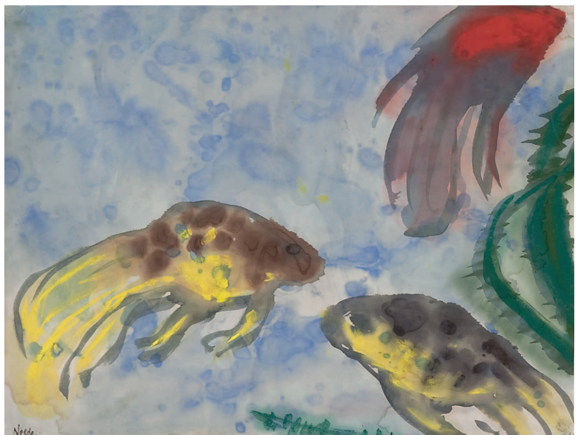
Hans 'Emil' Nolde (Hans Emil Hansen) Sluierstaarten (Aquarium)

'Van dit schilderijtje begrijp ik niet dat er nog geen nieuwe eigenaar voor is. We hebben het al een tijdje. Het blijft een prachtstuk!'