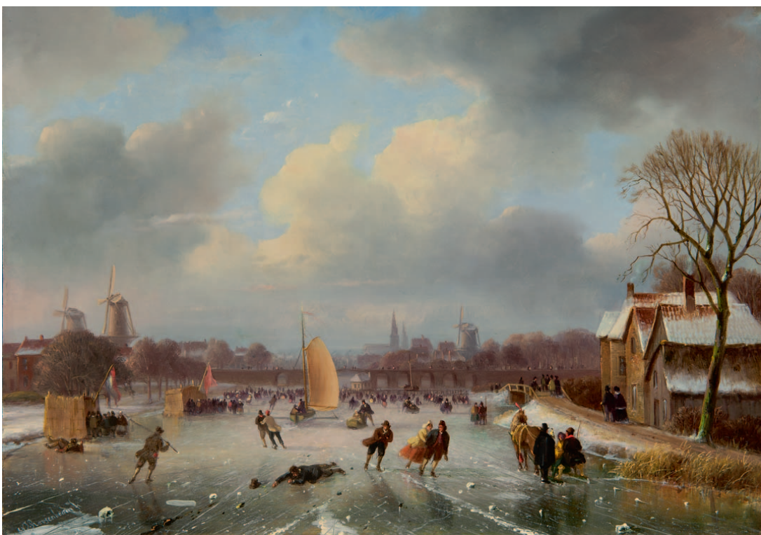
Nicolaas Johannes Roosenboom Winterpret met ijszeilboot en schaatsers